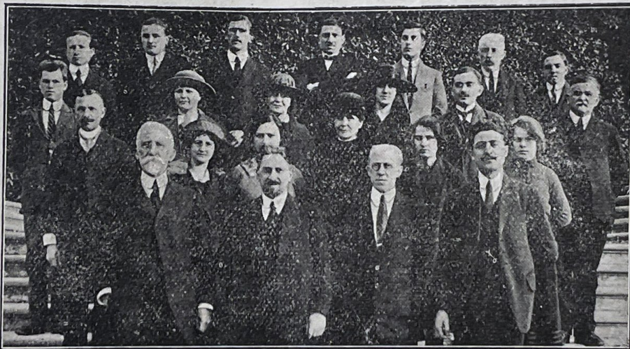
Participants au cours de Nîmes

On raconte qu'un guide suisse, dans les hautes Alpes, conduisait un jour un groupe de touristes.