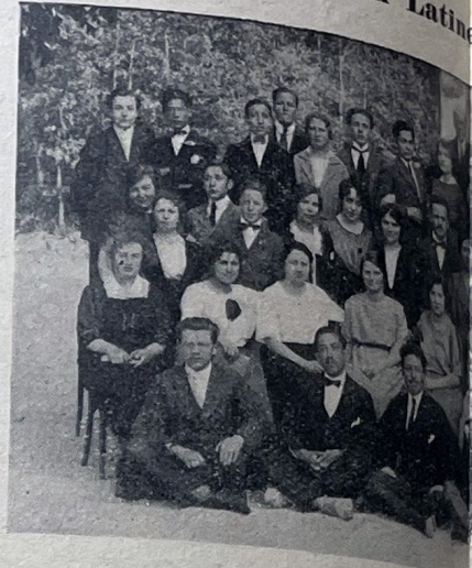
Quelques-uns des élèves