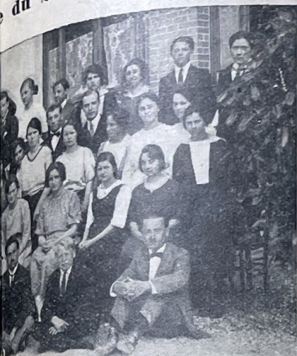
colporteurs du séminaire