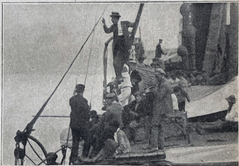
Réfugiés européens contemplant l'incendie de Smyrne

Gueuz-Lépé est relié à Smyrne par une ligne de tramways à chevaux et un service de bateau à vapeur. Eh bien, pendant trois jours, les 10,