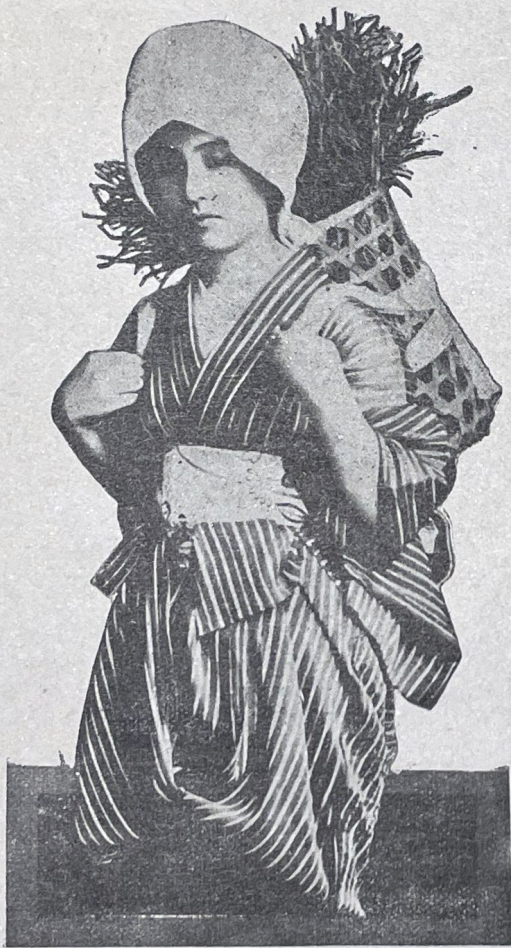
Jeune fermière japonaise

plus de foi qu'eux, et je déclarai : « Demandons 5.000 yen (soit 13.750 francs). Mais, de nouveau, les frères répondirent : « Non, non, il ne faut pas dépasser 3.000 yen. » Un frère, le prédicateur Okahira, membre du comité, prit la parole : « Demandons 10.000 yen », dit-il. Je fus très surpris, car je croyais que 5.000 yen serait la limite. En me rendant à l'église, je rencontrai un frère qui me dit : « Nous n'avons pas fixé une assez grande somme ; nous pouvons certainement dépasser 10.000 yen, car j'ai déjà des souscriptions pour 8.000 yen. C'était le mercredi matin ; le jeudi, le comité se réunit à nouveau. Un frère japonais proposa que nous demandions 20.000 yen. Considérant les événements du jour précédent, je répondis de suite : « Allright, 20.000 yen. » Il y eut encore discussion ; mais enfin il fut décidé qu'on demanderait 20.000 yen, car un frère annonça qu'il en donnerait 10.000 lui-même. Au même instant, un frère japonais proposa de porter la somme à 40.000 yen, car sa femme et lui-même en donneraient 20.000. L'objectif fut donc fixé à 50.000 yen.