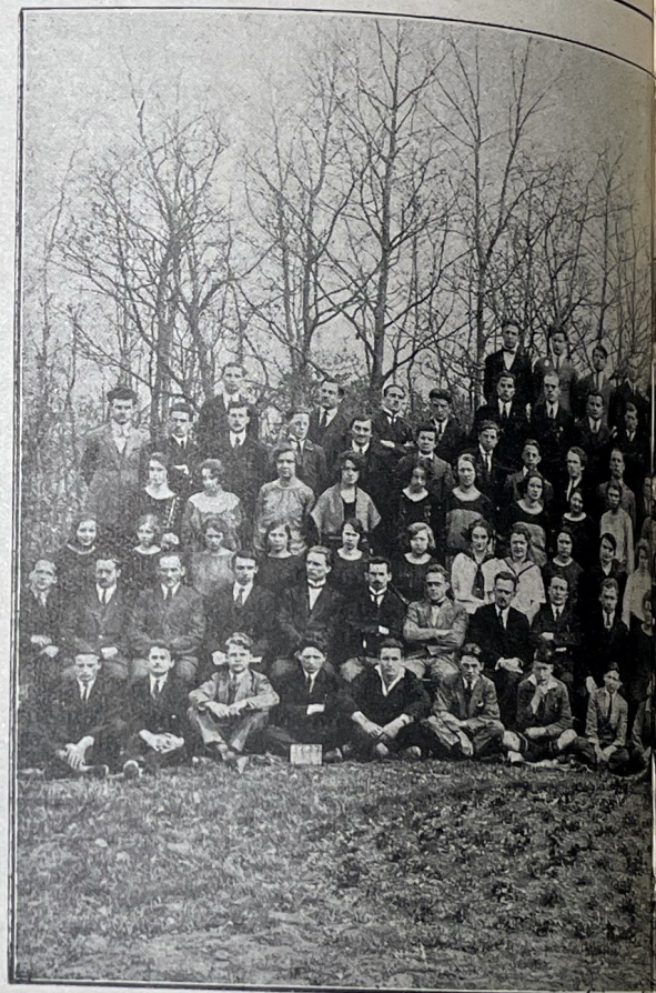
Les bienheureux de l'École

Nous avons acheté, il y a deux mois, une nouvelle pièce de terre d'un hectare et demi, qui agrandira notre jardin potager. Trois vaches sont maintenant logées dans notre étable ; un rucher vient d'être établi par un de nos élèves. Nos cultures nous ont valu le 1 er Prix du département de la Haute-Savoie. Nous avons planté un grand nombre d'arbres fruitiers, de framboisiers, de groseillers. Le nombre de nos couches a été doublé, ce qui nous permet d'avoir des légumes pour la consommation avant qu'on puisse les trouver sur le marché. De bons