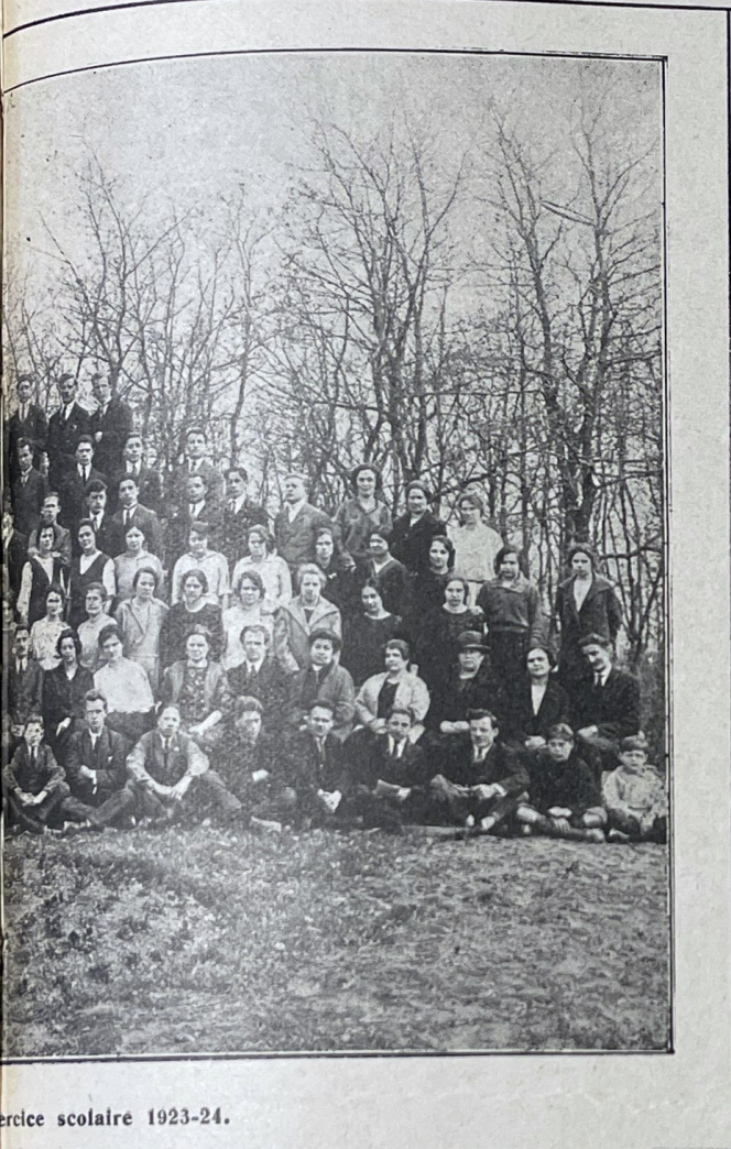
exercice scolaire 1923-24.

L'esprit de prophétie conseille vivement l'établissement, dans chaque conférence, d'un fonds de se-